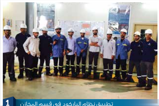
1 تطبيق نظام الباركود في قسم المخازن Barcoding Implementation in Warehouse