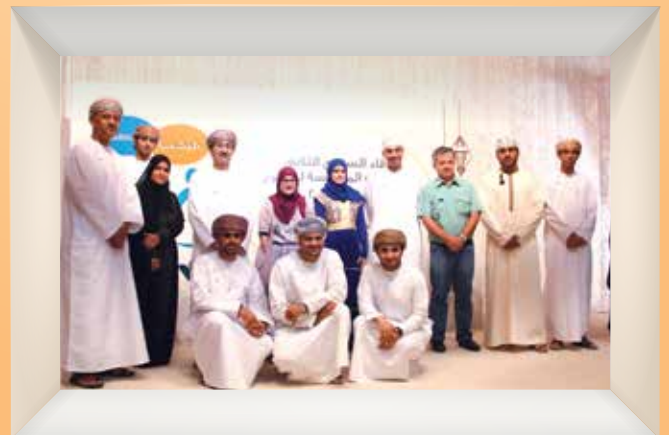
الإفطار السنوي الثاني لإدارات الشركات المؤسسة لجسور Second Meet and Greet Iftar Gathering for Managements of the Founding companies