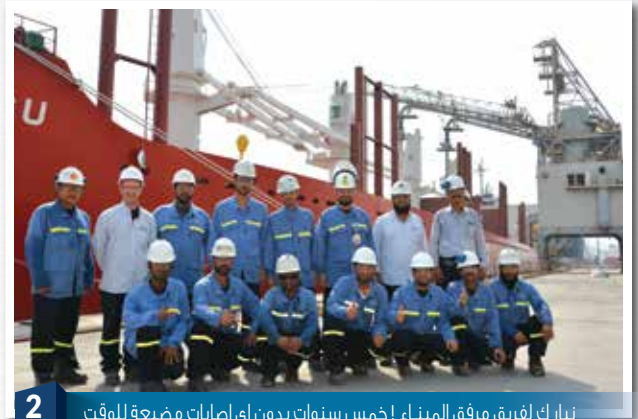
2 نبارك لفريق مرفق الميناء! خمس سنوات بدون اي اصابات مضيعة للوقت Congratulatory! 5 Years LTI Free at Port Facility.