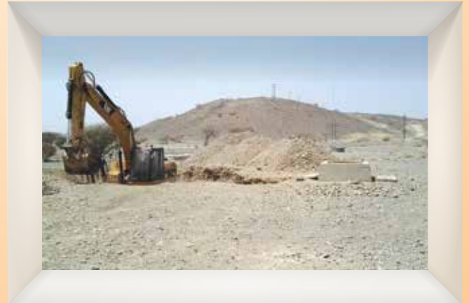
بدء أعمال صيانة فلج الصباح وفلج القبائل Maintenance Work Begins at Falaj Al Sibakh and Falaj Al Qabail