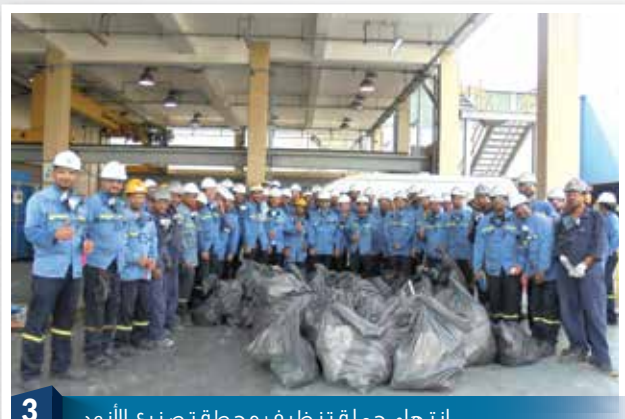
3 إنتهاء حملة تنظيف محطة تصنيع الأنود Completion of Anode Plant Cleanup Drive