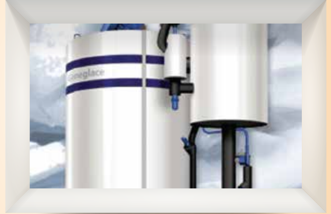
وحدة إنتاج الثلج بسوق لوى للأسماك قيد الإنشاء Ice Making Unit in Liwa Fish Market Under Establishment