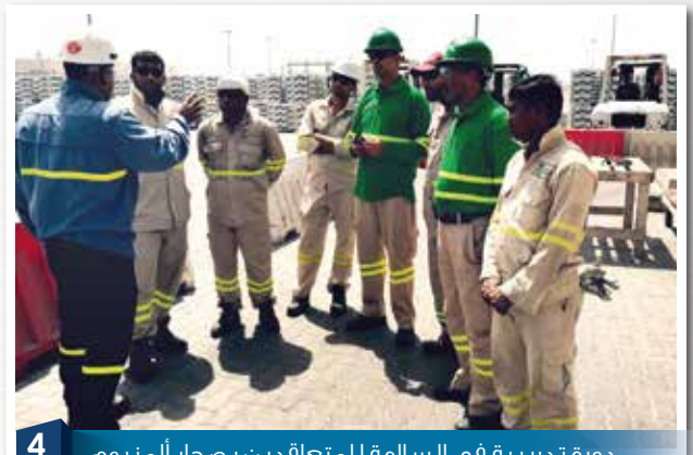
4 دورة تدريبية في السلامة للمتعاقدين بصحار ألنيوم Contractor's Safety Training at Sohar Aluminium