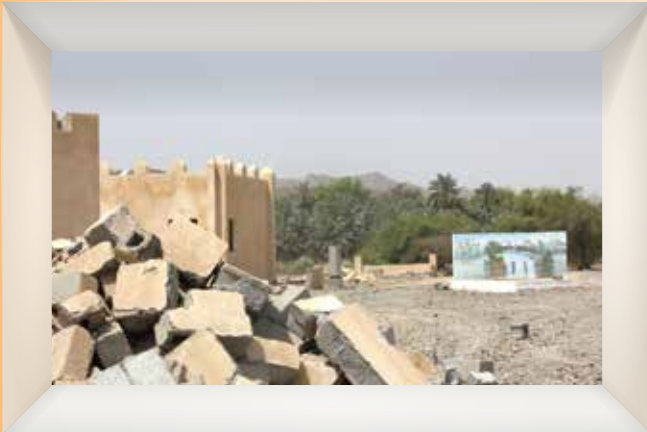
بدء الأعمال الإنشائية لتطوير منتزه فزح بولاية لوى Construction Starts in Fizh Park at Liwa