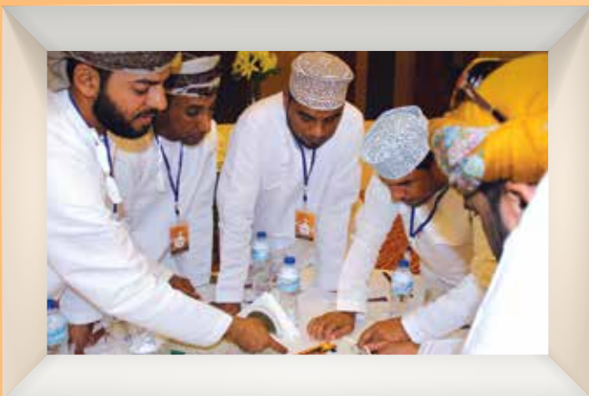
١٧ مبادرة تطوعية تتنافس لنيل جائزة جسور للعمل التطوعي 17 Voluntary Initiatives Compete to Win Jusoor Volunteering Award