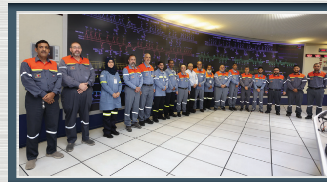
تبادل الخبرات في مجالات تعزيز الطاقة والصيانة ومؤشرات كفاءة الأداء مع فريق ألمنيوم البحرين (ألبا). Exchanging Insights on Power Augmentation, Maintenance, Obsolescence Management, and Efficiency KPIs with Aluminium Bahrain (Alba).