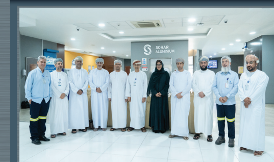
إدارة مجموعة نماء تلتقي بالرئيس التنفيذي لصحار ألمنيوم Nama Group's Management Met the CEO of Sohar Aluminium