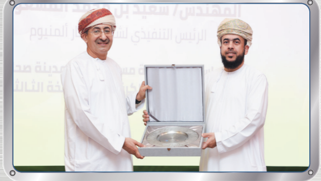
الرئيس التنفيذي لصحار ألومنيوم يرعى حفل سحب قرعة كأس مدينة صحار الصناعية لكرة القدم ٢٠٢٥

Sohar Aluminium's Participation in the 6th Bowling Competition for the Private Sector's Female Employees