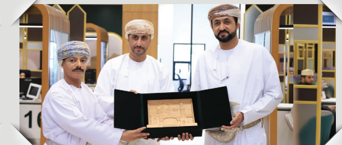
المبادرات المجتمعية لصندوق الحماية الاجتماعية Community Initiatives of the Social Protection Fund (SPF)