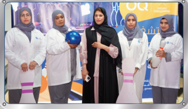
مشاركة صحار ألومنيوم في مسابقة البولينج السادسة لموظفات القطاع الخاص

Sohar Aluminium's Participation in the 6th Bowling Competition for the Private Sector's Female Employees