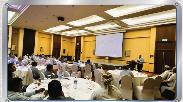
نظمت شركة صحار ألومنيوم حلقة العمل الأولى في التخطيط

Sohar Aluminium kicked off the 2025 Future Leaders (HiPo) Programme