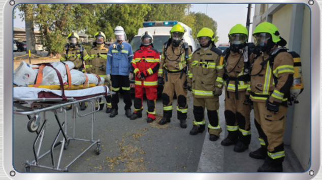
تمرين إخلاء وإنقاذ في ورشة معهد صحار للتدريب الصناعي

Distribution of 1000 Seedlings Coinciding with the Omani Agriculture Day