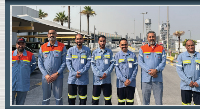
الاطلاع على العمليات اللوجستية لدى ألبا وشركة إي بي إم تيرمينالز Understanding Logistics Operations at ALBA and APM Terminals