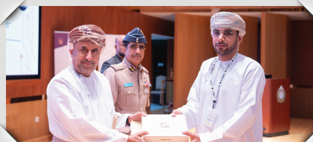
المؤتمر الدولي للهندسة المتقدمة والعلوم والتكنولوجيا The International Conference on Engineering Advancements, Science, and Technology (ICEAST)