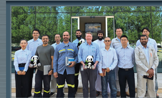
بحث فرص التعاون مع شركة البولي سيليكون المتحدة للطاقة الشمسية Exploring Collaboration Opportunities with United Solar Polysilicon