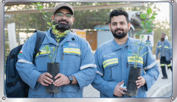
توزيع ١٠٠٠ شتلة تزامنا مع يوم الزراعة العماني

CEO of Sohar Aluminium Presides Over the Draw Ceremony of Sohar Industrial City Football Cup 2025