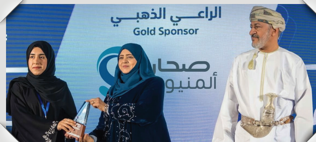
ملتقى المهندسات العمانيات Omani Women Engineers Forum