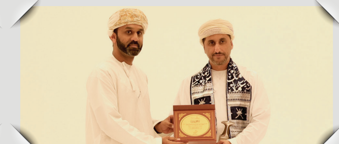
ملتقى الأمن المائي Water Security Forum

مؤسسة جسور ذراع الاستثمار الاجتماعي لشركات صحر أمنيوم، وفالي عمان، وأوكيو Jusoor Foundation is the social investment arm of Sohar Aluminium, Vale Oman and OQ