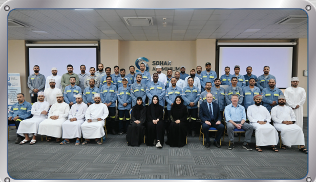
أطلقت صحار ألومنيوم برنامج قادة المستقبل لعام ٢٠٢٥

Fire & Rescue Drill at Sohar Industrial Training Institute's Workshop