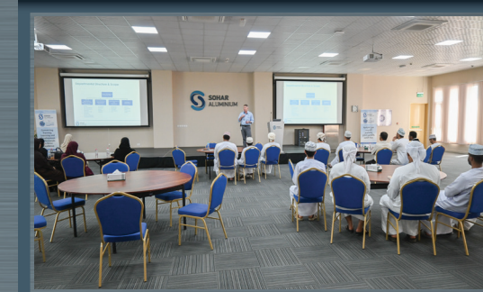
تعرف طلبة جامعة التقنية والعلوم التطبيقية بشناس على ممارسات إدارة المواهب Students from the University of Technology and Applied Sciences (UTAS)-Shinas Explore Talent Management Practices