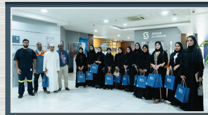
اطلاع طلبة جامعة التقنية والعلوم التطبيقية على تجربة الشركة في مجال تقنية المعلومات Students from University of Technology and Applied Sciences (UTAS)- Sohar learn about Sohar Aluminium's expertise in IT