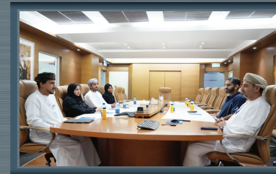
بحث فرص التعاون بين الشركة وجامعة صحار Collaboration Opportunities Explored between Sohar Aluminium and Sohar University