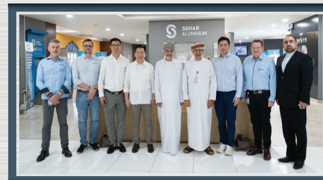
بحث فرص التعاون مع شركة شيامن للألمنيوم Exploring Collaboration Opportunities with Xiamen C&D Aluminium Company